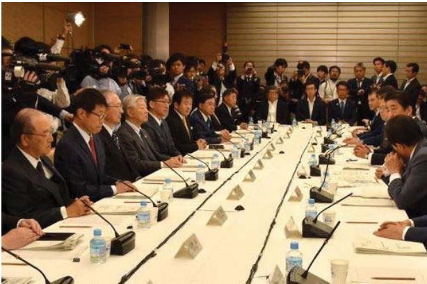
あいさつする安倍首相（右から2人目）と三村会頭（左）、鳥澤委員（左から5人目）

政府は5月15日、「第27回未来投資会議」を首相官邸で開催した。会議では、成長戦略や高齢者雇用の促進などについて議論した。会議には日本商工会議所の三村明夫会頭と、