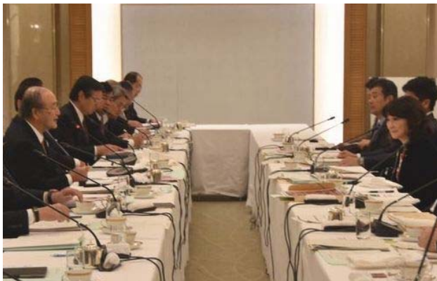
あいさつする三村会頭（左）と片山大臣（右）

日本商工会議所は1月17日、片山さつき地方創生担当大臣との懇談会を都内で開催した。日商の三村明夫会頭は、地方創生を実現するための5カ年計画である現行の「まち・ひと・しごと創生総合戦略」が4年を過ぎ、2020年から始まる次期総合戦略策定に当