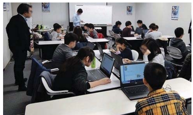
「ENTRY」レベルを受験する小中学生

日商プログラミング検定の詳細については、 https://www.kentei.ne.jp/pg を参照。