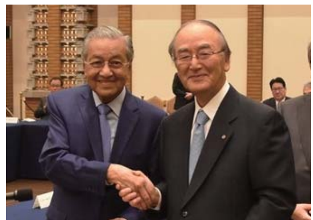
マハティール首相(左)と三村会頭

日本商工会議所は6月12日、マレーシアのマハティール首相との懇談会を都内で開催した。マハティール首相は、「マレーシアは日本から技術だけではなく、職業倫理や勤労についても学んだ。今後も日本の人と技術で発展を加速させ、先進国の仲間入りを果たしたい」と日本からの投資に期待を寄せた。日商の三村明夫会頭は、「マレーシアの発展を思う強い気持ち、日本に対する強い期待と行動力に心から敬意を表したい」と述べた。