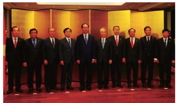
クアン国家主席（左から5人目）と小林委員長（左から3人目）