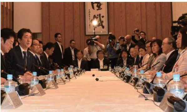
あいさつする安倍首相（左から2人目）と三村会頭（右から2人目）

政府は5月17日、「第16回未来投資会議」を首相官邸で開催した。会合では、林業の成長産業化などについて議論した。会議に出席した日本商工会議所の三村明夫会頭は、林業