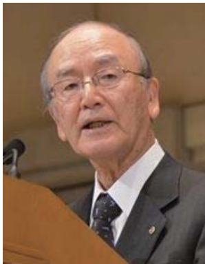
あいさつする三村会頭