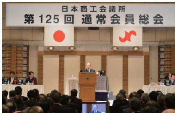
全国から約1000人の会頭・副会頭らが出席