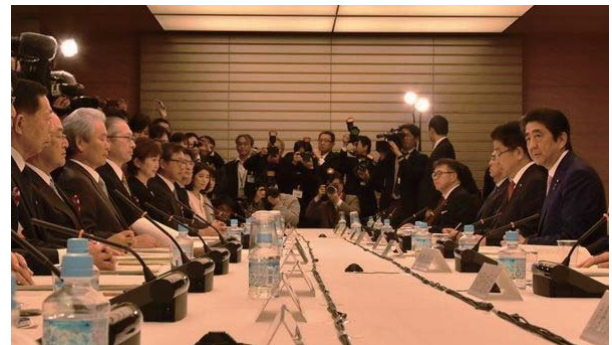
あいさつする安倍首相（右）と三村会頭（左から2人目）

日本商工会議所の三村明夫会頭は、大企業の働き方改革によるしわ寄せが中小企業に及ばないように、中小企業の実態を十分踏まえた検討を要請した。