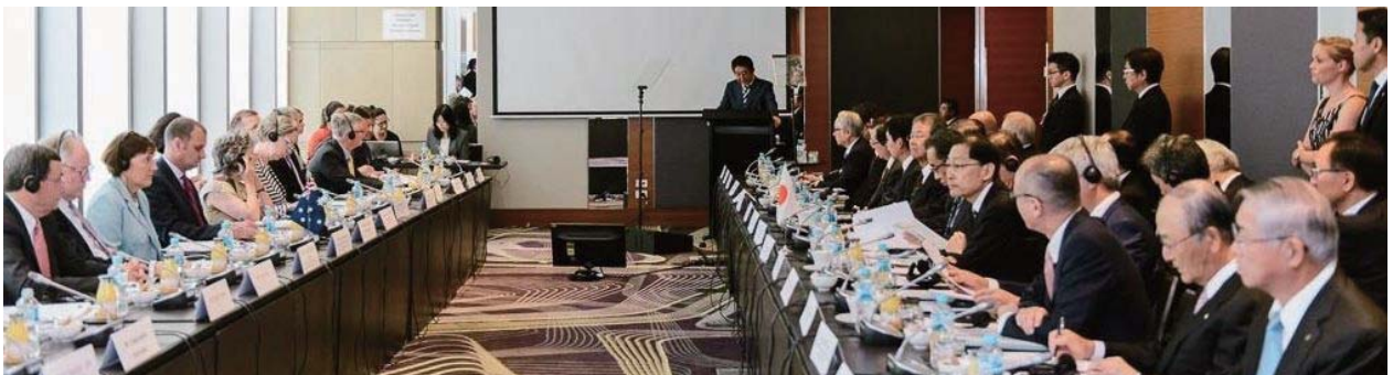
ビジネス会合であいさつする安倍首相（中央奥）と三村会頭（右から2人目）

日本商工会議所の三村明夫会頭は、1月に行われた安倍晋三首相のオーストラリア訪問に同行した。三村会頭は、1月14日にシドニーで開催された政府主催の「ビジネス会