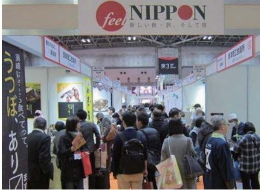
多くの来場者でにぎわう会場

日本商工会議所は2月8～10日、東京ビッグサイトで共同展示商談会「feel NIPPON 春2017」を開催した。会場では、全国50商工会議所が、「地域力活用新事業∞全国展開プロジェクト」によって開発した「食」「旅」「技」の地域オリジナル商品をPR。各ブースは多くの来場者でにぎわった。今回は熊本県復興支援として、熊本県商工会議所連合会から8商工会議所が熊本発の逸品をアピールした。