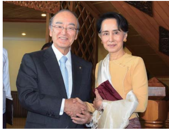
握手するスー・チー国家最高顧問（右）と三村会頭

日本商工会議所は1月22～28日、三村明夫会頭を団長とする「訪ベトナム・ミャンマー経済ミッション」を派遣した。ミッションでは、ベトナムのグエン・スアン・フック首