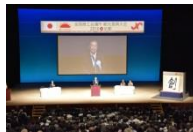
▲全国商工会議所 観光振興大会2016 (7月、京都)