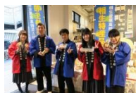
▲「地域つまいもんマルシェ」で 名産品を販売する地元高校生 (3月、東京)