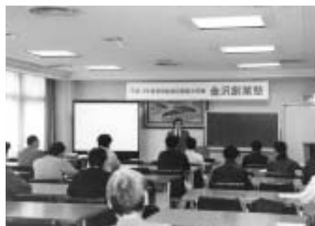
全国で創業塾を開催