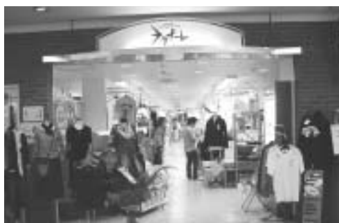
ミニチャレンジショップ・ヨリナーレ （新潟県新潟市）