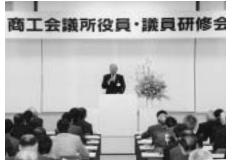
商工会議所役員・議員研修会を開催