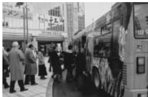
市民に定着した中心街100円循環バス （山形県山形市）