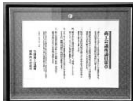
商工会議所議員憲章