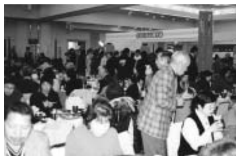
地元の味を世界にアピール・寿司サミット （大分県佐伯市）