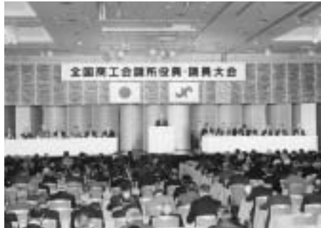
商工会議所役員・議員大会を開催