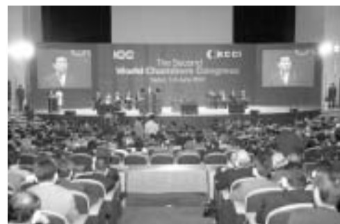
第2回世界商工会議所大会に参加