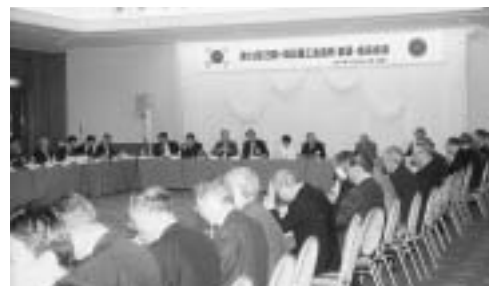
日韓・韓日商工会議所会頭・会長会議を開催