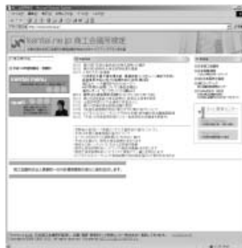
商工会議所検定のホームページ