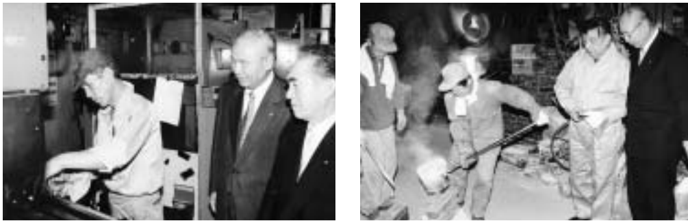
中小企業の工場を視察する山口会頭 (左：大田区、右：東大阪市)