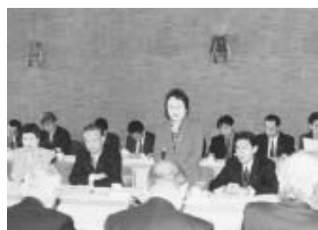
遠山文部科学大臣との懇談会