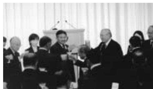
ムシャラフ・パキスタン大統領歓迎昼食会