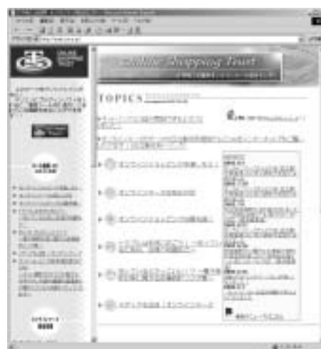
ネット通販のポータルサイトをスタート