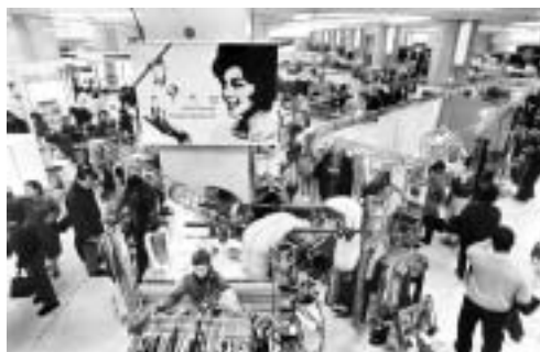
ベンチャー発掘を目的とした大規模イベント 「あきない百稼店」（大阪府大阪市）