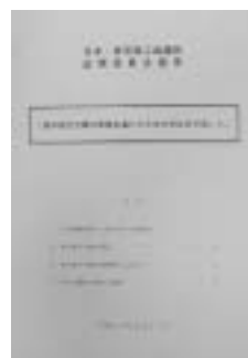
報告書 「真の地方分権の実現を通じた日本の再生を目指して」