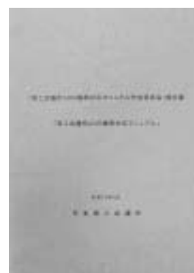
ADR標準対応マニュアル