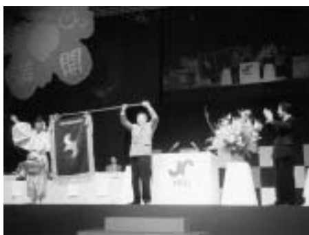
第21回商工会議所青年部全国大会