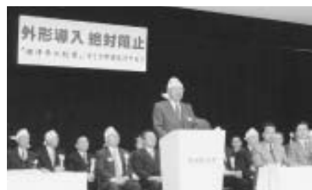
外形標準課税導入反対協議会緊急総会を開催