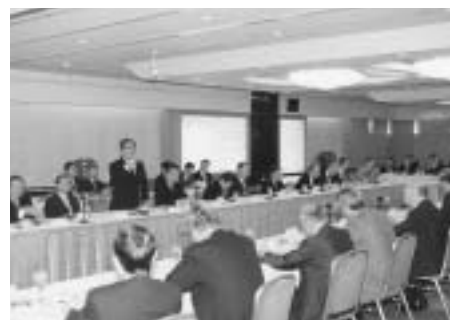
片山総務大臣・総務省幹部との懇談会