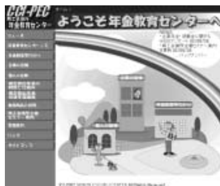
商工会議所年金教育センターのホームページ