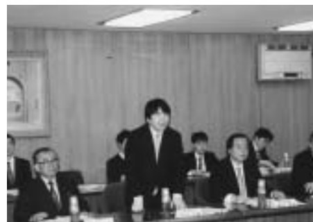
竹中経済財政政策担当大臣・ 内閣府幹部との懇談会