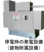
(中小企業経営強化税制の強化イメージ)