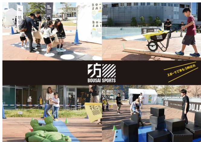
▲ 防災スポーツの様子