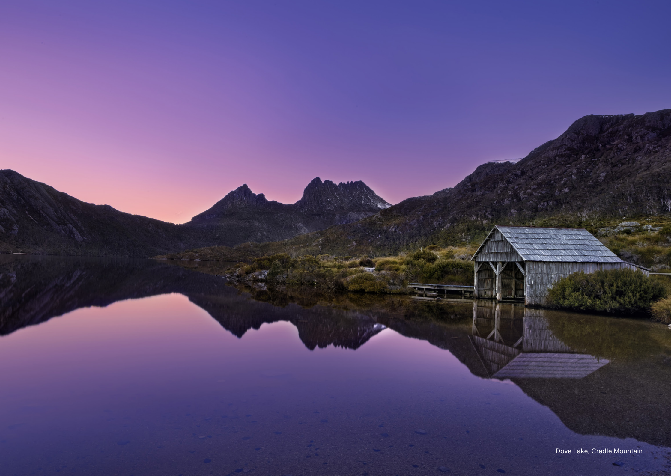
Dove Lake, Cradle Mountain