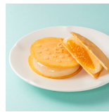
瀬戸内の八朔せとこまち