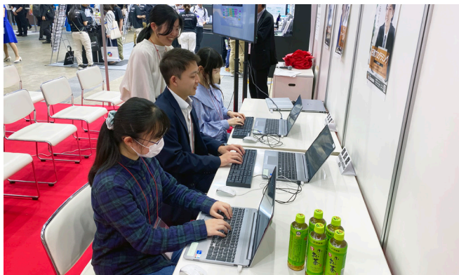
試験を体験する学生

し、積極的にアピールした。日商ブースに立ち寄った徳島県の教育関係者は「プログラミング教室を運営しており、小中学生向けの教材を探しに来た。生徒のプログラミング能力やスキルレベルを判断するツールとして、日商プログラミング検定の活用を検討したい」と話した。神奈川県教育関係者からは「実際に試験を体験したことで、日商PC検定に興味を持った。地元の商工会議所を紹介してほしい」との依頼もあった。