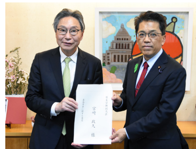
宮崎副大臣（右）に要望書を手交する小山田委員長

を持って適用されることから、法の趣旨にのっとった審議決定が求められる」と強調。「2022年度の審議以降、公労使が3要素に関するデータを基に審議を重ね、各種統計を参照する形で目安額決定の根拠が明確に示されるなど、中央ではプロセスの適正化が一定程度図られてきた」と一定の評価を示す一方で、「こうした取り組みが継続され、中央はもとより、地方においてもデータによる明確な根拠に基づく納得感のある審議決定を強く求める」と要請した。