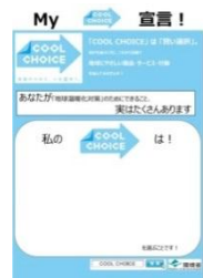
「My COOL CHOICE」宣言シート

10月31日～11月3日・11月7日～8日まで大阪府の万博記念公園にて開催された、「第24回 ロハスフェスタ in 万博公園」に後援し、ブース出展を行いました。「COOL CHOICE」についてのパネル展示・チラシの提供を行ったほか、自分の「COOL CHOICE」を記入してもらうシートを配布し、「COOL CHOICE」の周知を行いました。