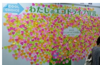
「わたしのエコドライブ宣言」ボード

10月30日～11月8日まで東京ビッグサイトで開催された「第44回東京モーターショー2015」に、環境省ブースを出展し、「COOL CHOICE」及び、「IPCCレポートコミュニケーター事業」の紹介のほか、パネルや映像にて「エコドライブ」「エコカーの選択」の取組について紹介を行いました。エコドライブの体験コーナーや、「わたしのエコドライブ宣言」を貼付するボードを設置し、来場者の方にエコドライブを楽しく学んでいただきました。