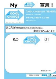
「My COOL CHOICE」宣言シート

11月14日に、横浜クイーンズスクエアにて開催された、地産地消への理解を深めるイベント、「よこはま食と農の祭典2015 ～ようこそ横浜農場へ～」にて、横浜市のブースへポスターを掲出し、チラシやノベルティの提供を行いました。会場内では、来場者から「MY COOLCHOICE宣言」を集め、集まった「My COOL CHOICE 宣言！」は、12月11日～15日に横浜市役所1F市民広間で紹介される予定です。