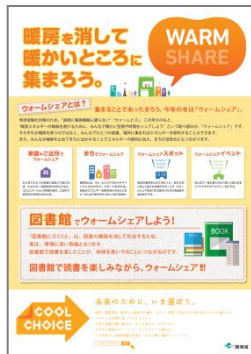
図書館バージョン