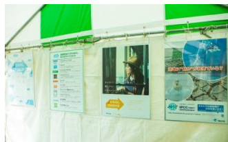
ブースでのパネル展示