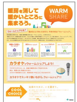
カラオケバージョン

環境省では、冬の地球温暖化対策の一つとして推進している、「ウォームビズ」の一環として、みんなで暖かいところに集まることでエネルギーの節約につなげる「ウォームシェア」を11月1日から3月31日まで呼び掛けています。「ウォームシェア」の取組をさらに広げるため、参加を呼びかけるポスターを作成しました。場所を限定しない汎用版に加え、「映画館」「図書館」「居酒屋」「カラオケ」でのウォームシェアを呼びかける計5種類を用意しています。