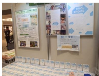
ブースでのパネル展示