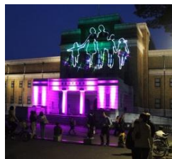
国立科学博物館LEDライトアップ