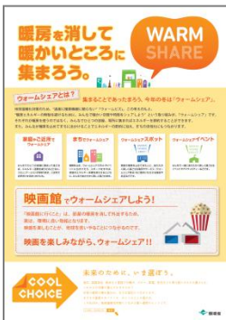
映画館バージョン