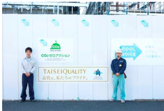
建設現場仮囲いと現場スタッフ

建設現場の仮囲いや、現場事務所の扉にロゴを掲出し、低炭素社会の実現をリードするエコ・ファースト企業としての、環境保全への積極的な姿勢の周知を行っています。