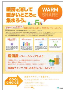
居酒屋バージョン