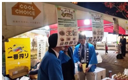
イベント会場の様子

11月6日～11月7日に和光市で開催された、鍋のキックオフイベントにてロゴを掲出し、鍋を食べることも、「COOL CHOICE」の一つである「ウォームシェア」であることを周知しました。