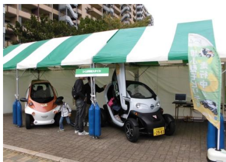
導入された2種の超小型モビリティ

地域の低炭素交通スタイルの実現を目指し、つくば市が9月から実施している実証実験に導入された超小型モビリティのボディに、ロゴを掲出しています。