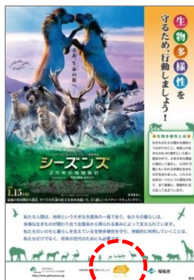
ポスタービジュアル

2016年1月15日から公開する、映画「シーズズ 2万年の地球旅行」とタイアップして作成したポスターにロゴを掲出し、生物多様性を維持することにもつながる、「COOL CHOICE」の周知を行っています。