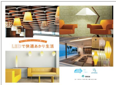
冊子表紙/中ページ