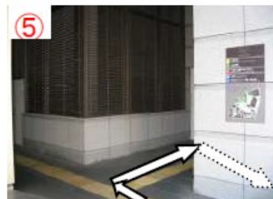
⑤ 階段を上ったところ