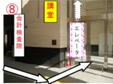
⑧ 講堂入口から入りエレベータで 講堂に向かう