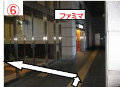
⑥ ファミリーマート手前の自動ドアから入る