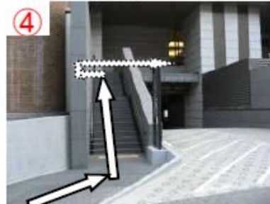
④ 階段を上り、自動ドアへ向かう