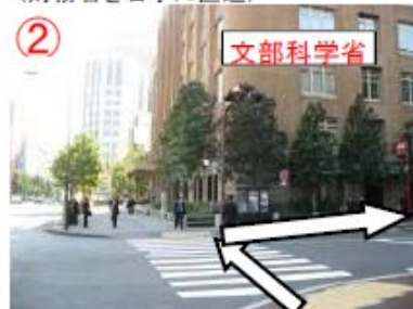
② 交差点を右折(写真の建物は文部科学省)