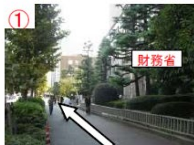
① 霞ヶ関駅A13番出口 (財務省を右手に直進)