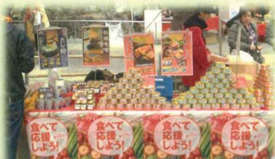
被災地産食品の販売フェア