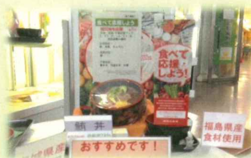
被災地産食品を使用したメニューの提供