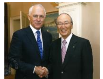
（ターンブル首相と三村委員長）

開催地：オーストラリア／シドニー （キリビリハウス・フォーシーズンズホテル） 参加者：22 名（同行ミッション）／88 名（晩餐会）