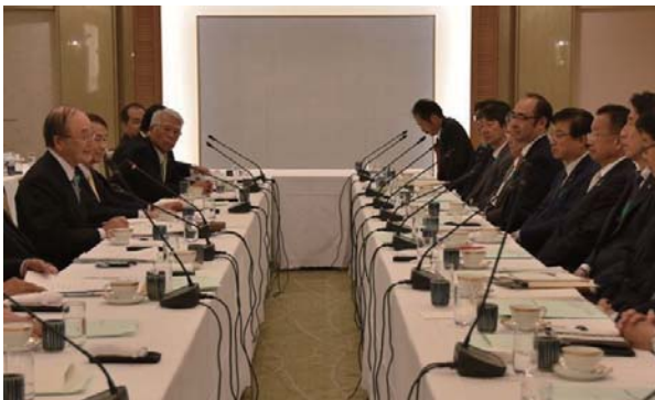
あいさつする三村会頭（左）と山本大臣（右から3人目）

日本商工会議所は4月19日、山本有二農林水産大臣との懇談会を都内で開催した。三村明夫会頭は、「わが国の農林水産業は、商工業との連携強化により、まだ十分に成長の余地がある」と指摘。「今後は、農林水産業の