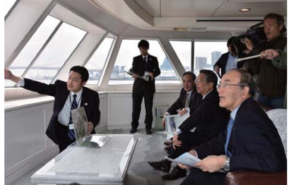
視察船内で説明を受ける三村会頭（右）

日本商工会議所の三村明夫会頭は4月10日、東京港の視察を行った。同視察会は、経済界の視点から東京港への理解をさらに深め、社会資本整備の具体的なストック効果を広く発信する目的で実施。視察船から新客船ターミナルや新コンテナターミナルの整備状況、2020年東京オリンピック・パラリンピック競技大会の会場予定地などを視察した。三村会頭は「将来を見据えて、整備計画を着実に実行していくことが重要」と指摘した。